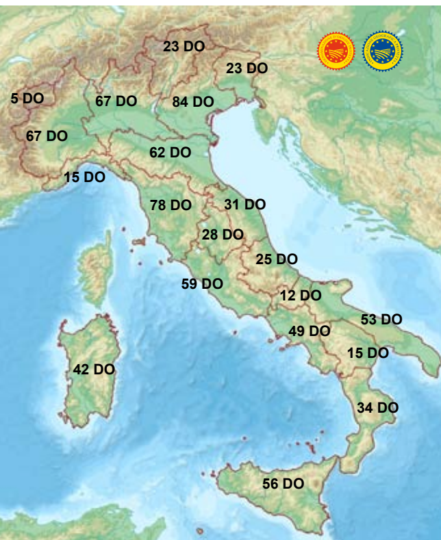
LA CLASSIFICA DELLE REGIONI PER DENOMINAZIONI FOOD&WINE

764 denominazioni italiane ad oggi registrate si traducono sugli scaffali di vendita in oltre 2000 tipologie diverse di prodotti.